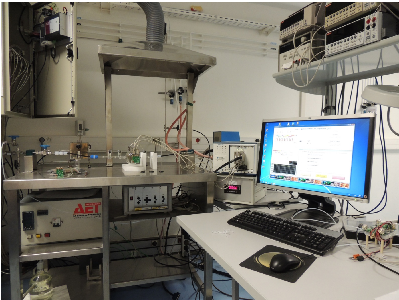
Fig. 2 : Le banc de test s'appuie sur une instrumentation PXI pilotée sous LabWindows/CVI.