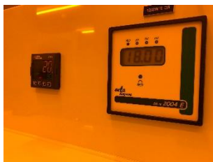
Figure 5 : mesure de la résistivité de l'eau de rinçage