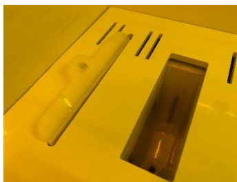
Figure 3 : bac chauffant