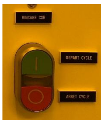
Figure 4 : commande de rinçage automatique