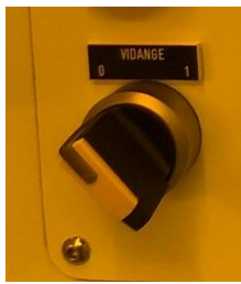
Figure 1 : commande vidange du bac chauffant