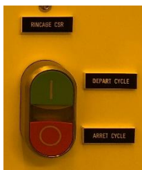
Figure 4 : commande de rinçage automatique