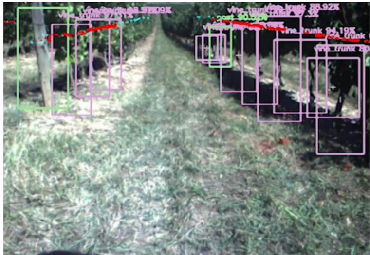
Figure 2 : Vue de la rangée par la caméra du robot, avec les différents pieds de vigne détectés