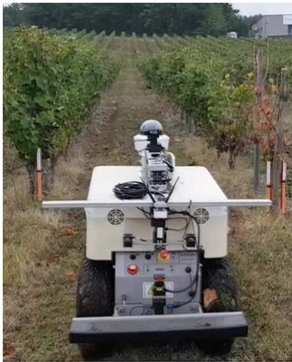
Figure 1 : le robot au début de la rangée de vigne